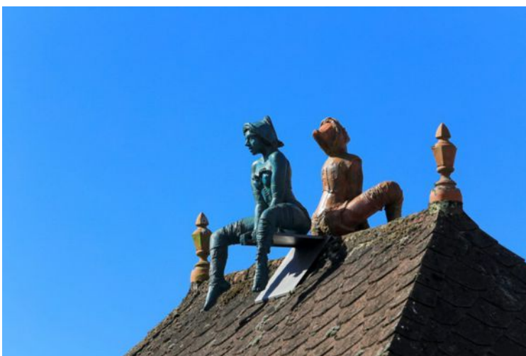
Attentive, les sœurs jumelles