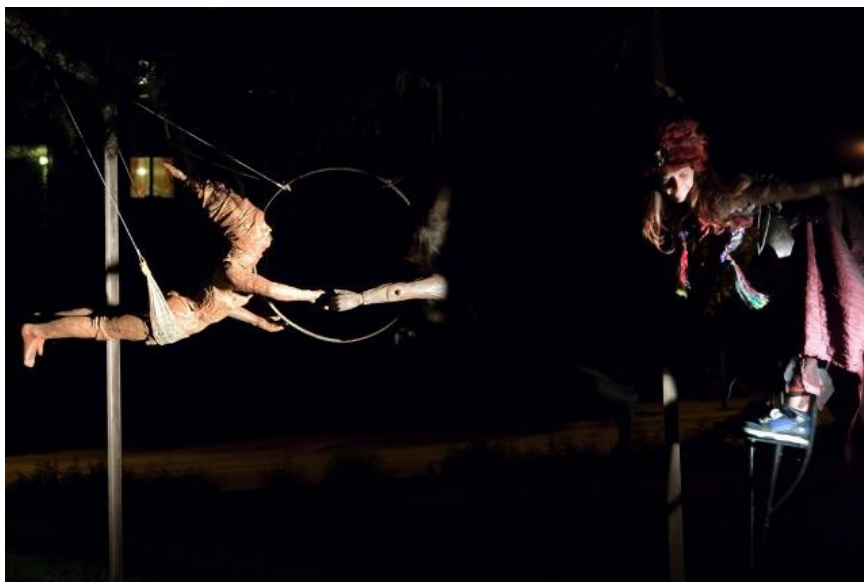
Spectacle au Cimetière des Maures

+ Performances de danseurs, de musiciens et d'acteurs de rue autour de la scénographie des sculptures monumentales.