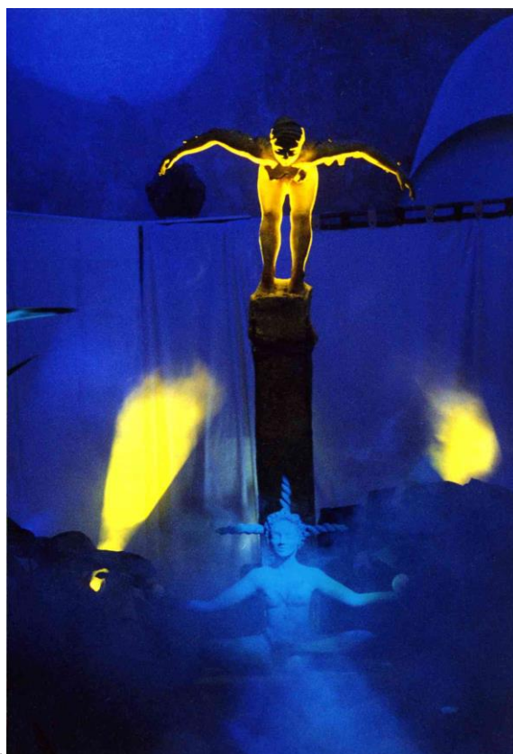
Son et lumière à Eze bord de mer