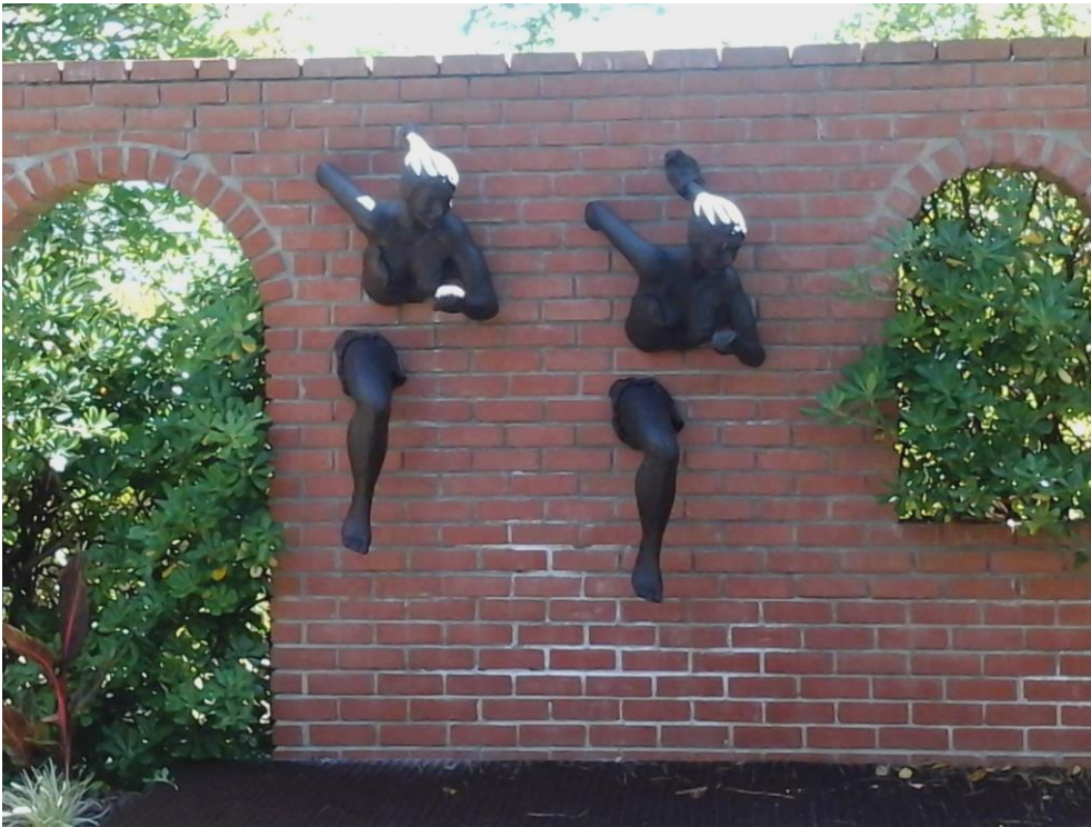
Jardin paysagé dans le Var (83)

Deux sculptures de 1,20m de hauteur – Résine